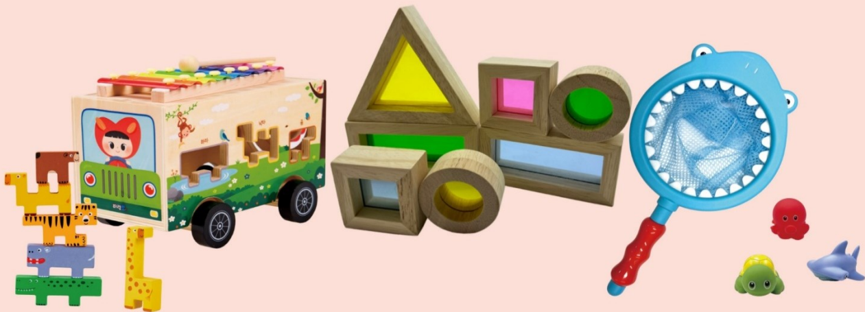
사파리버스 + 레인보우 블록 + 상어낚시